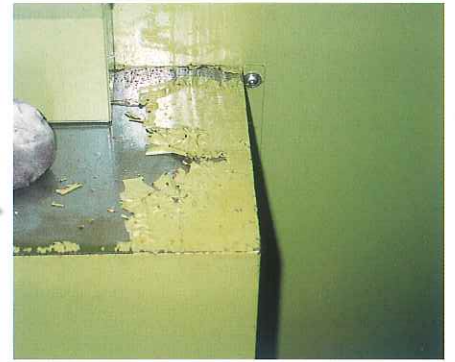
塗膜のハクリ・浮き